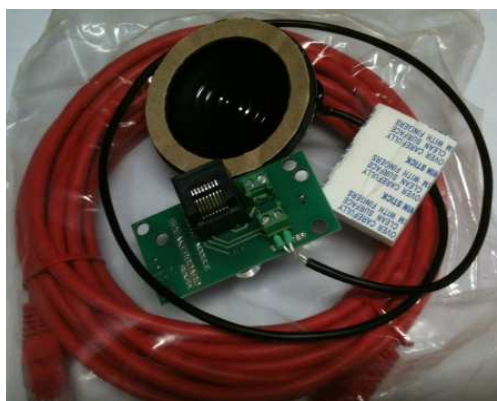
Contenu du paquet