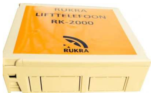
Boîtier en plastique(RK-2015) OPTION