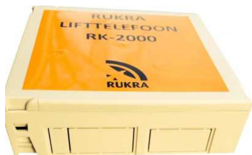
Kunststof behuizing(RK-2015) OPTIE